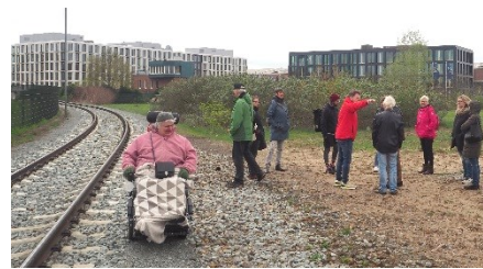
Begehung des Wunschgeländes an der Hafensstraße für ein Zentrum für Seelische Gesundheit

Aber nicht nur Spaß und Kultur hatten ihren Platz, auch die gesundheitspolitische Arbeit kam nicht zu kurz: Der „Arbeitskreis Neue Psychiatrie im Bremer Westen“ setzt sich weiter für den Umbau der Psychiatrie von stationär zu ambulant ein, ist mit Politik und Praxis im Gespräch und prägt die Berichterstattung in den Medien.