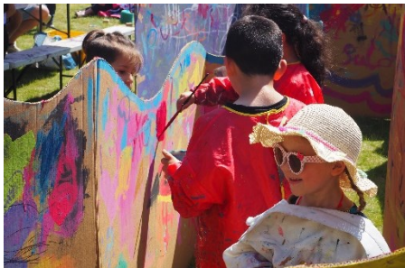
Kinderfest im BlauHausGarten im Juni 2023

Mit dieser phantastischen Hilfe werden wir unseren Café- und unseren Veranstaltungsbe- reich professionalisieren. Und die Blaue Manege kann noch besser zu einem Ort werden, an dem man sich trifft, sieht und ins Gespräch kommt, wo getanzt, gekocht und diskutiert wird. Hier kann man Musik machen und hören oder einfach verweilen.