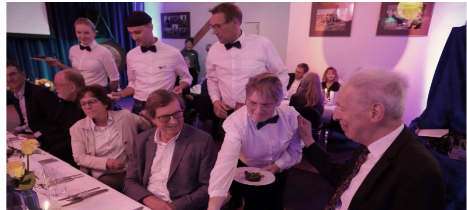
Benefizabend in der Blauen Manege im Oktober 2023

Dafür hat uns besonders ein Ereignis mächtigen Rückenwind verschafft: Bei unserem festlichen Benefizabend im Oktober haben sich über 80 Menschen von den Bremer Spitzenköchen und einem bunten Kulturprogramm verwöhnen lassen. An diesem Abend und im Nachgang haben sie Spenden in Höhe von rund 28.000 € zusammengetragen.