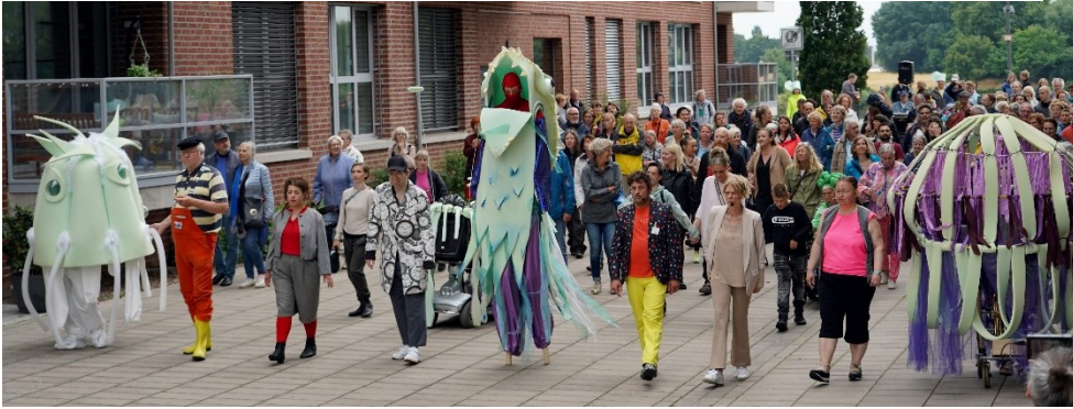
„Da kommt WAS“ am 01. Juli in der Bremer Überseestadt