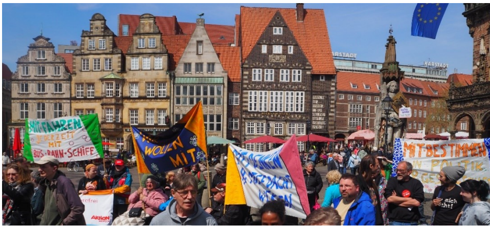
Europäischer Protesttag für Gleichstellung von Menschen mit Behinderung 2023 im Mai 2023

Mit dieser phantastischen Hilfe werden wir unseren Café- und unseren Veranstaltungsbe- reich professionalisieren. Und die Blaue Manege kann noch besser zu einem Ort werden, an dem man sich trifft, sieht und ins Gespräch kommt, wo getanzt, gekocht und diskutiert wird. Hier kann man Musik machen und hören oder einfach verweilen.