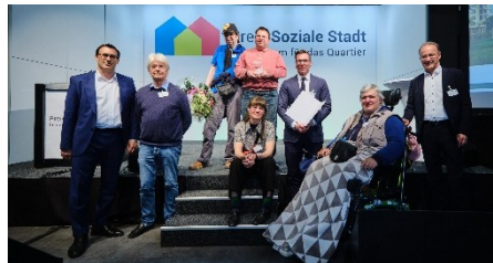
Preis Soziale Stadt 2023 im Juni in Berlin

Dazu gehören sowohl initiative Nachbar:innen, die z.B. ein Kinderfest mitgestalten, eine aktive Gartengruppe, aber auch die Ehrung des BlauHaus-Projekts zusammen mit der Gewoba mit dem Preis Soziale Stadt 2023 .