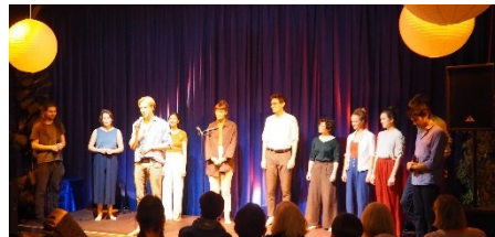
Neilon a cappella: Konzert im November 2023

Waren die Premiere des Theaterspaziergangs „Da kommt WAS“ im Juli mit Gastspielen in Hamburg und Mannheim (wer neugierig ist, kann sich den Film über das Theaterprojekt auf unserer neuen Webseite ansehen) und das Benefizessen im Oktober.